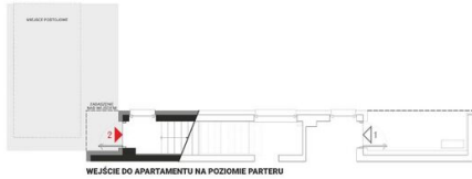
WEJŚCIE DO APARTAMENTU NA POZIOMIE PARTERU